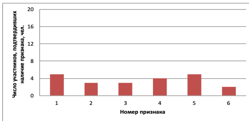
Рис. 3. Диагностика профессионального выгорания (окончание контрольного учебного года)