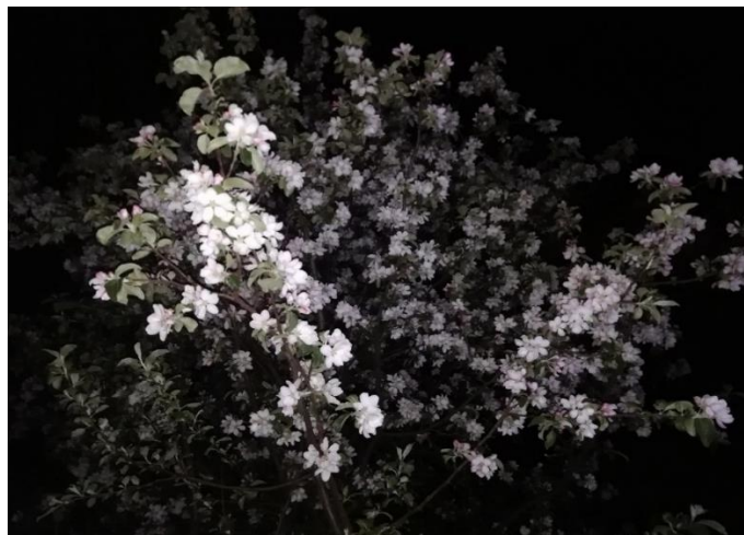
Рис. 2. Фотоголос студентки ВятГУ для выявления смысловых характеристик ценности патриотизм

Проиллюстрируем вышеизложенное примером. При обсуждении понятия «патриотизм» студенткой Б. Т. для обсуждения был представлен фотообъект – цветущая яблоня (рис. 2).