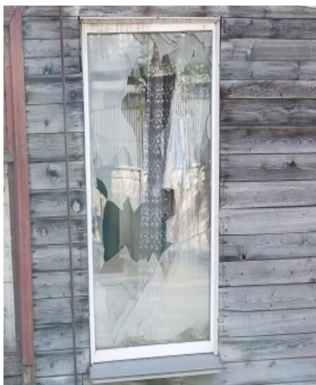
Рис. 3. Фотоголос студента ВятГУ для выявления смысловых характеристик ценности гуманизм

Приведем пример кейса по изучению смысловых характеристик ценности гуманизм в представлении студента ВятГУ (рис. 3).