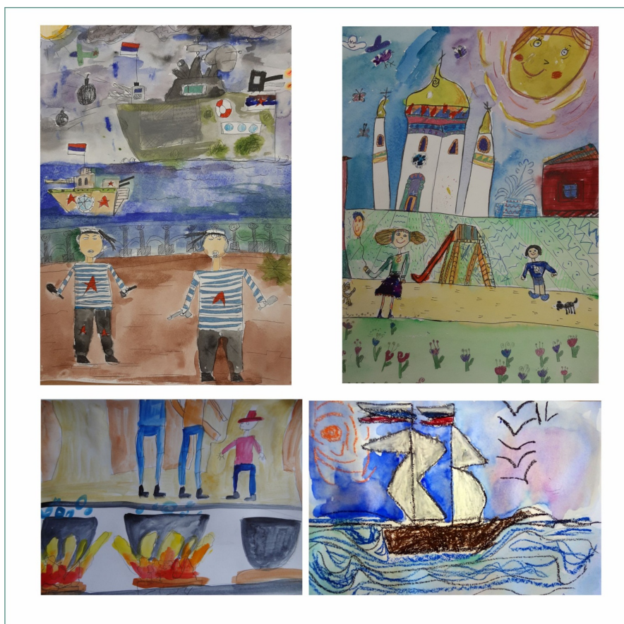
Рис. 3. Работы детей старшего дошкольного возраста, выполненные акварелью в сочетании с масляной пастелью и гелевыми ручками

Работа с гелевыми ручками достаточно кропотлива: требует предварительного карандашного наброска, затем живописным слоем ложится акварель, и только после высыхания красочного слоя прорисовываются ручками детали, орнаменты, контуры. Обычно такая работа занимает не менее двух занятий и подходит старшим дошкольникам. А вот масляная пастель доступна и детям помладше. Форму предметов рисуют мелками, мелкие детали также закрашиваются пастелью, а большие пространства – акварельными красками. Особенно ребята любят «волшебный» эффект белого мелка. Ведь его становится видно на листе только после нанесения акварельного слоя. Также удобно, что после высыхания краски можно добавить некоторые недостающие штрихи снова пастелью (рис. 3).