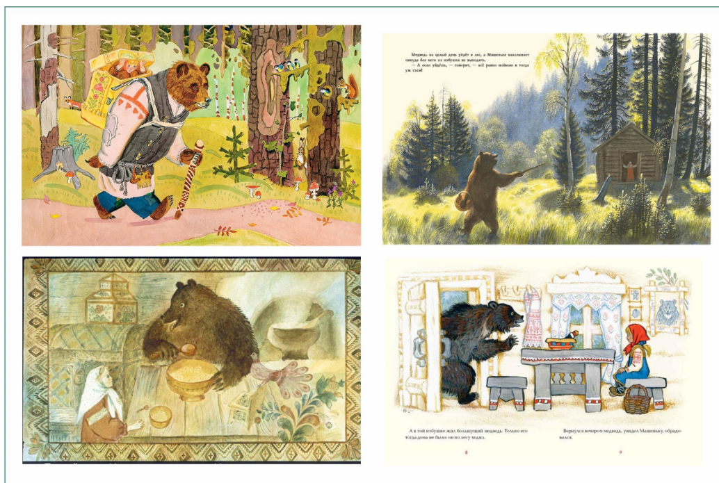
Рис. 2. Иллюстрации к сказке «Маша и медведь», выполненные акварелью. Н. М. Кочергин, В. Н. Лосин, Г. А. Скотина, Н. А. Устинов

ноименным мультфильмом, полезно разобрать на примере иллюстраций таких художников: Н. М. Кочергина, В. Н. Лосина, Г. А. Скотиной, Н. А. Устинова (рис. 2). На наш взгляд, только после этого у них появляется свое индивидуальное и личностное видение персонажей.