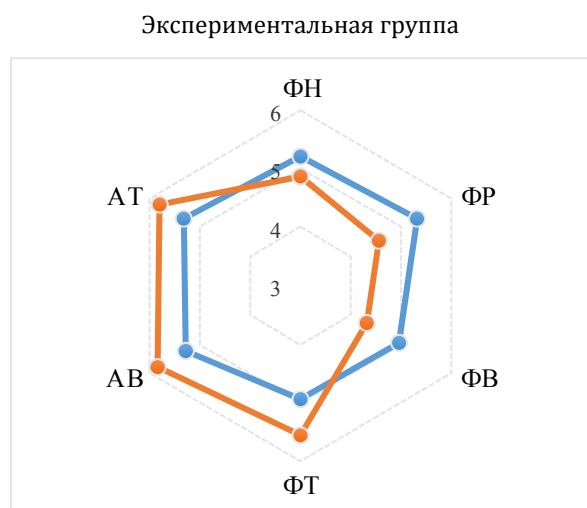
Рис. 2. Динамика эмоционального статуса испытуемых ЭГ

У детей ЭГ определена различная динамика показателей критерия «положительные и нейтральные эмоциональные состояния». Так как в содержательной интерпретации функциональные состояния, определяющие эмоциональный статус ребенка, имеют как позитивную, так и негативную модальность, то установленные сдвиги у детей ЭГ характеризуются разной направленностью (рис. 2). При этом в КГ, как уже было отмечено ранее, статистически значимых сдвигов по функциональным состояниям не выявлено (рис. 3).