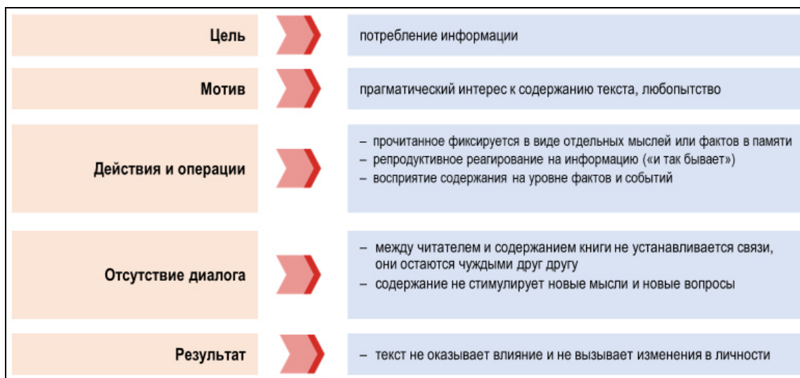
Рис. 5. Содержание и структура чтения как потребления информации

Люди, ориентированные на «потребительское» чтение, могут читать текст, воспринимать слова, понимать логическое построение фраз и их смысл и в лучшем случае дословно пересказать то, что говорит автор. Содержание книги не становится частью их собственного смыслового мира, не расширяет и не обогащает его. Вместо этого такие читатели все прочитанное в книге просто фиксируют в виде отдельных мыслей или фактов в своей памяти и сохраняют их. Между читателем и содержанием книги не устанавливается никакой связи, они остаются чуждыми друг другу, разве что читатель становится обладателем некой коллекции чужих высказываний, сформулированных автором.