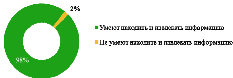
Рис. 2. Результат анализа умения поиска информации

Вместе с тем 2 % испытуемых не смогли найти нужную информацию, показав отрицательный результат, что ставит под сомнение саму возможность получения полноценного высшего образования (Рис. 2).