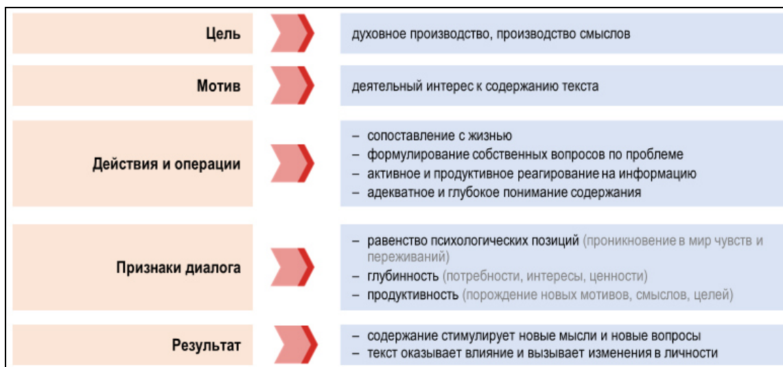
Рис. 1. Содержание и структура чтения как диалога читателя с автором

Читатель-субъект никогда не приступает к книге, даже абсолютно неизвестного автора, будучи tabula rasa . Он уже интересовался данной темой, размышлял над проблемами, которые будут рассматриваться в книге, в связи с этим у него возникли свои собственные вопросы. Он не пассивное вместилище для слов и мыслей, он читает и понимает, и, получая информацию, реагирует на нее активно и продуктивно. То, что он читает, стимулирует его собственные размышления. У него рождаются новые вопросы, возникают новые идеи.