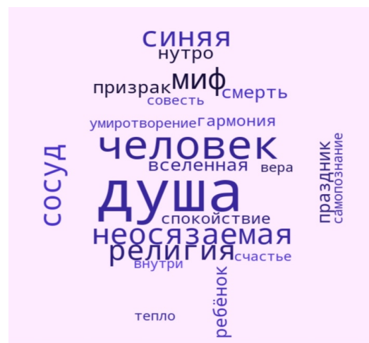
Рис. 2. Облако слов слушателей ДУ ДГУ

Анализируя полученные данные, мы приходим к выводу о том, что ассоциативное поле отражает частичку образа мира, сохранённого в памяти и сознании человека. Приём выявляет особенности мироощущения составителя, способствует самоидентификации личности с Миром, человечеством, русской нацией, русским языком.