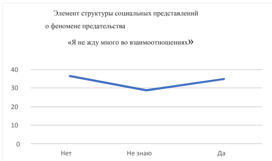
Рис. 1. Распределение ответов элемента «Я не жду много в своих отношениях» в социальных представлениях респондентов

Распределение ответов по стратегии «Я не жду много в моих взаимоотношениях» показывает, что одна часть участников выбирает, а другая отвергает стратегию. График представлен на рисунке 1.