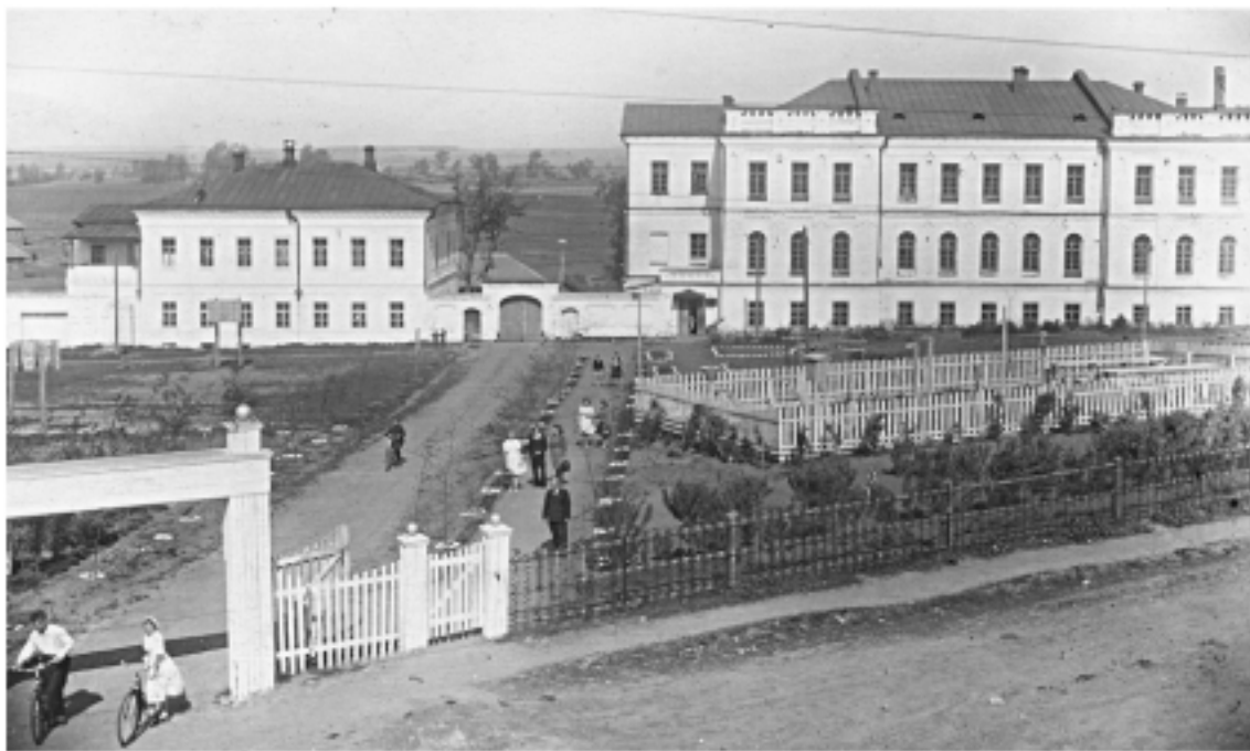
Здания № 14 и 16 по ул. Карла Маркса

Другие высшие учебные заведения, которым всё же удалось уцелеть, потеряли, по крайней мере, на некоторое время, свои здания и в опре-