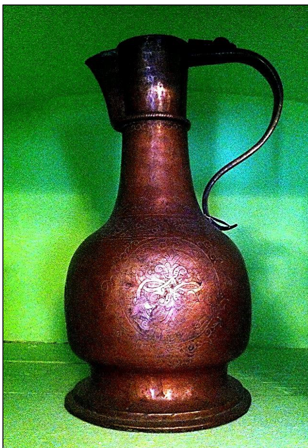
Рис. 1. Медный кувшин XVII в. (кумган). Изготовлен предположительно узбекским мастером. С ручкой и крышкой. На стенках кувшина выгравирован растительный орнамент. Дар М. А. Косарева. Поступил в Городецкий краеведческий музей в январе 1920 г. (ГРМ 581)

Выгодное с географической точки зрения расположение Нижегородской ярмарки давало возможность восточным купцам, пользуясь торговыми привилегиями, сбывать там значительную часть поставляемых в Российскую империю товаров. В частности, 9/10 товаров, доставляемых торговыми караванами из Бухарского ханства, продавались оптом фабрикантам и местным купцам именно в Нижнем Новгороде. В удачные, с точки зрения купцов, годы стоимость товара, ввозимого из Бухары в Россию, доходила до 8 млн рублей, что служило доказательством чрезвычайной важности этих торговых связей для Бухары. Сроки прибытия и возвращения караванов варьировали в зависимости от благоприятного для прохождения караванов сезона и продолжительности работы Нижегородской ярмарки, которая открывалась в середине июля и заканчивалась примерно 20 августа. В Нижнем Новгороде бухарские купцы закупали основную часть товаров, производимых в России. По свидетельству барона Е. К. Мейендорфа, принимавшего участие в поездке в Бухарское ханство в составе дипломатической миссии А. Ф. Негри (1820–1821 гг.), «бухарцы обычно вывозят русские товары только на сумму, равную половине стоимости ввезенных. На другую половину они приобретают голландские дукаты и эю, испанские пиастры, а также русские серебряные рубли, несмотря на запрещение вывоза последних. Товары, вывозимые из