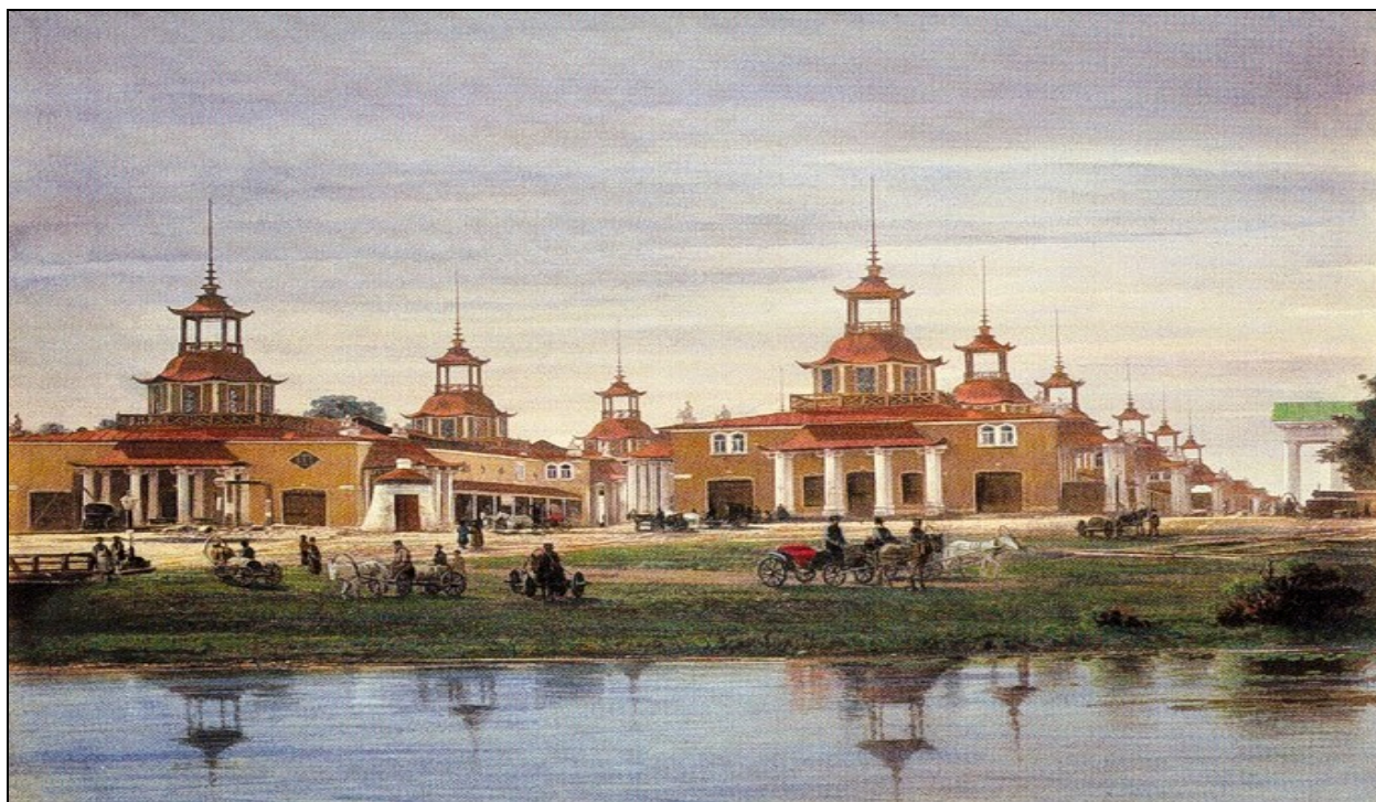
Рис. 2. Китайские ярмарочные ряды. Акварель по фотоотпечатку. Авторы А. О. Карелин и И. И. Шишкин

Именно китайский чай определял во многом ход ярмарочной торговли. Его продавали в китайских ярмарочных рядах, называемых Китайской линией и отличавшихся оригинальностью архитектуры.